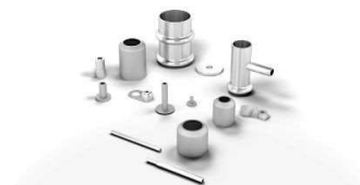
切削、鍛造、パイプ形状