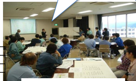
グループディスカッション発表の様子