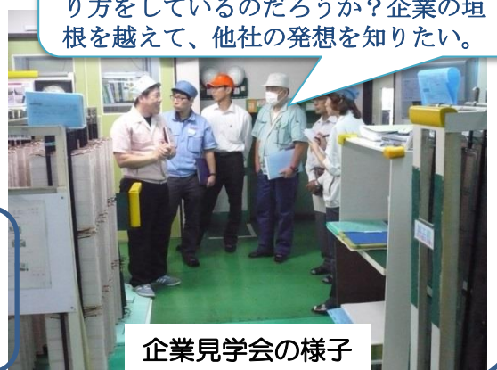
企業見学会の様子

他社はどのように5S・改善活動をしているのだろうか？どのような仕事のやり方をしているのだろうか？企業の垣根を越えて、他社の発想を知りたい。